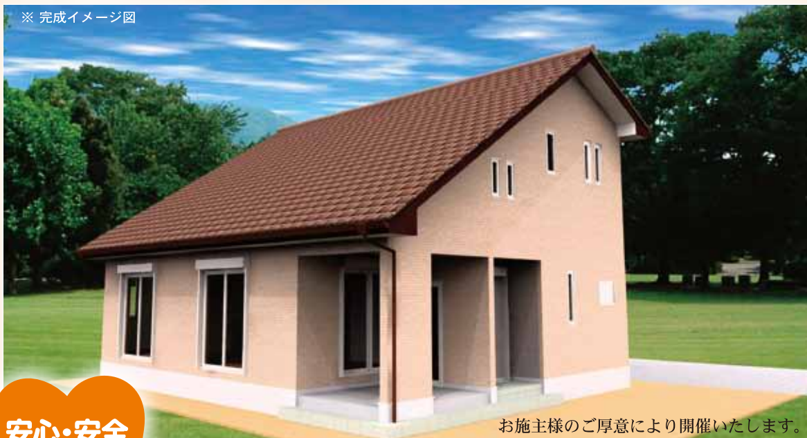
お施様のご厚意により開催いたします。