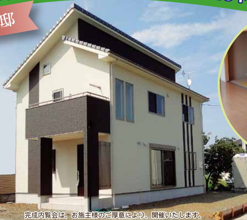
完成内覧会は、お施様のご厚意により、開催いたします。