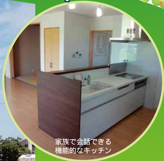
家族で会話できる 機能的なキッチン

当物件は、マイスター認定(■基礎・転圧マイスター・配筋マイスター・基礎仕上げマイスター、■内装・内装下地マイスター、■防水・防水紙マイスター、■屋根・平板瓦マイスター)を受けた職人が施工しています。